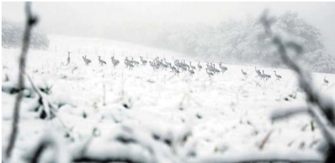
Una bandada de grullas, ayer en la localidad navarra de Gorriti.