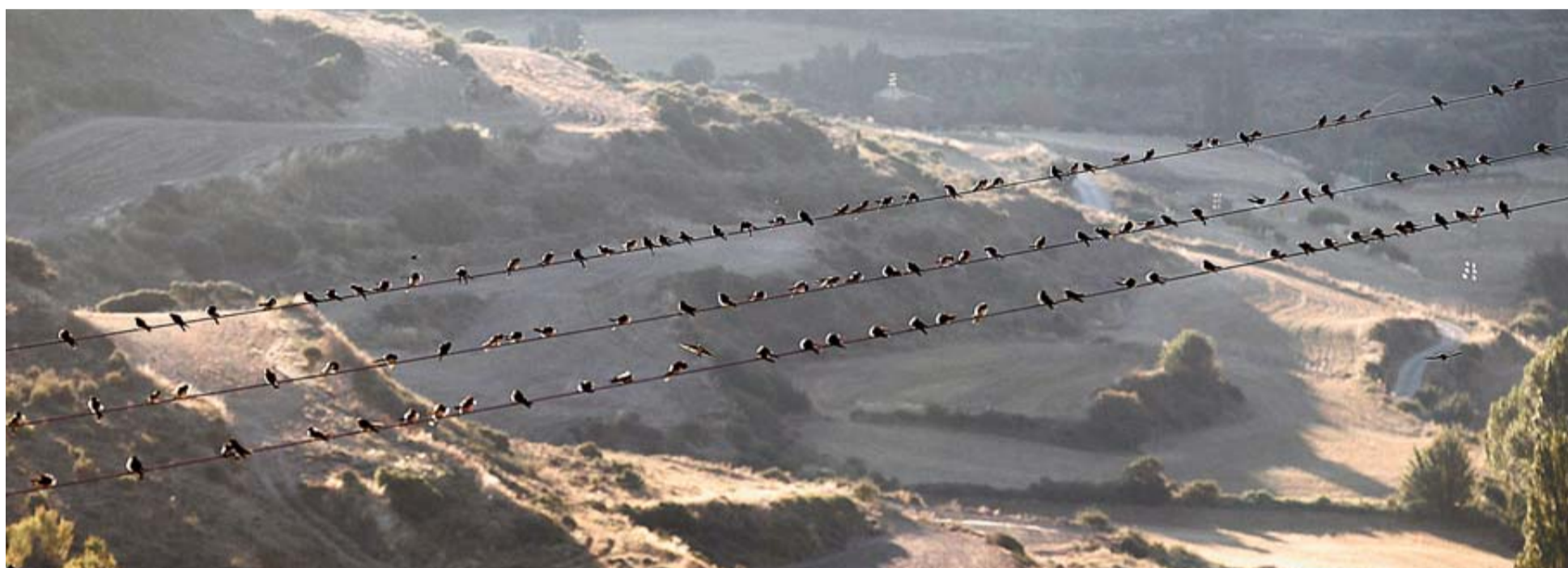
Unos 120 aviones comunes, aves muy similares a las golondrinas, descansan en tres cables del tendido eléctrico de Ujué, en una imagen tomada hace unos días.

Bandas de aviones comunes, aves muy similares a las golondrinas, descansan estos días en Ujué, en su periplo hacia tierras de África, donde pasan el invierno. La silueta medieval del municipio, casas con historia, convencen a las migrantes